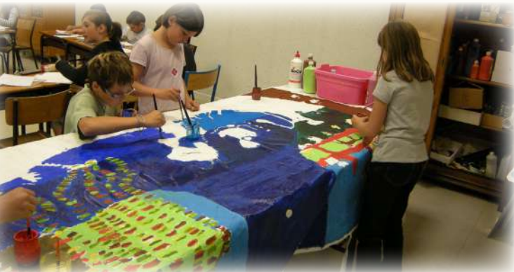
Les élèves de l'école Larbaud Curie travaillant sur leur oeuvre, « La Rivière des fantaisies migratoires », Prix Coup de Cœur RIFM 2011, 03 270 Saint Yorre

ANCE Autrefois, j'étais goutte de pluie, Flocon de neige ou ruisseau. Maintenant, je suis l'Ance dorée Découvrant des espaces infinis. Je roule dans mon lit creux Emportant les fonds sableux, Je coule sous les ponts Entraînant les poissons Dans un clapotement profond. Bientôt, je coulerai, légère, Vers la Loire belle et fière, En habillant les pierres De mousse et de lumière. « Ance », Prix Poésie RIFM 1999 63 840 Sauvassanges