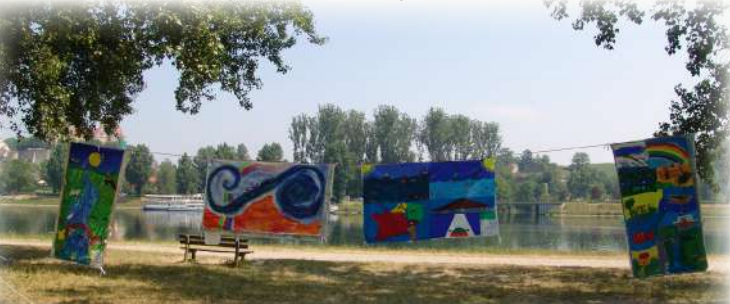
Exposition Rivières d'Images et Fleuves de Mots au bord du Rhin, 2005

Toutes les toiles sont conservées par SOS Loire Vivante - ERN France et mises à disposition gratuitement.