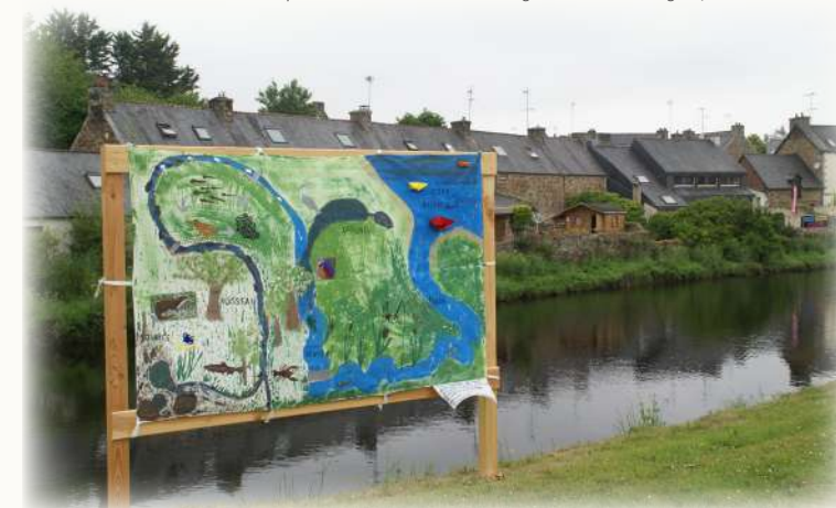
Exposition RIFM Rivières Sauvages au bord du Léguer, Lannion - 2018

L'exposition des oeuvres est une manière de reconstituer la carte artistique du bassin versant . Au fil du fleuve et de ses affluents elles permettent de découvrir ou redécouvrir les richesses d'un héritage naturel.