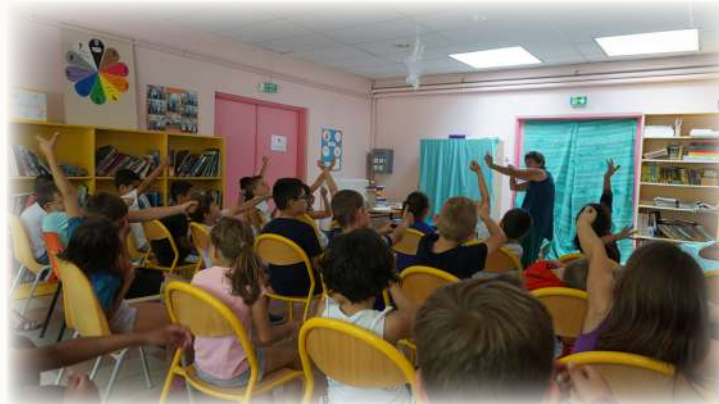
Intervention d'une conteuse à l'école Maurice Nugués de Saint-Vincent-Bragny

Elle est destinée aux enfants de la maternelle au collège, habitant dans le bassin d'un fleuve, de la source à l'océan, en passant par les affluents et affluents d'affluents.