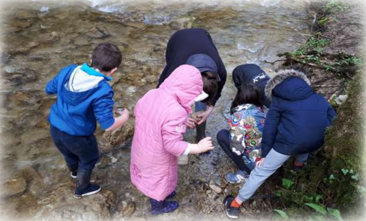
Sortie pédagogique sur les bords du ruisseau de Serrières-de-Briord, dans l'Ain.